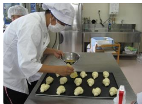
製パン作業の取り組み

オリーブの樹では開所から製パン作業活動を行うために、試行錯誤を繰り返し、平成20年度より販売を行ってまいりました。現在は地域の学童保育所をはじめとした多くの方々に購入していただいております。利用者の笑顔と意欲は販売を通じて益々意気盛んになって来ています。ご注文の際は前日までにお問い合わせ致します。