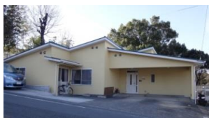
小羊デイケアホーム